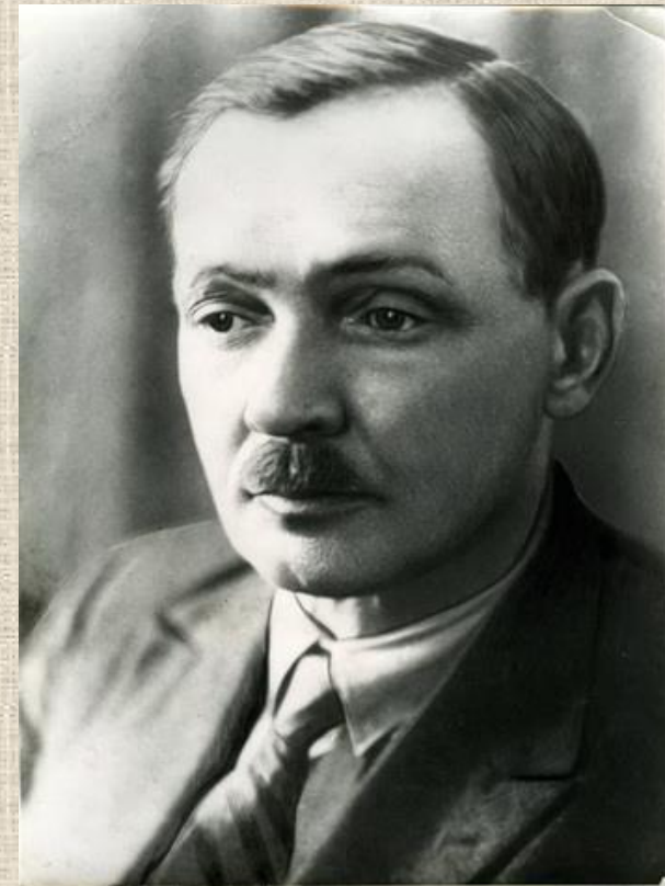
Янка Купала. 1929 г.

Па сведчанні Ю. А. Алейчанка, большая частка твораў са зборніка «Спадчына» напісаны ямбічнымі памерамі (8 разнавіднасцей). У вершах «Валачобнікі», «Свайму народу» і інш., а таксама ў санетах паэт упершыню выкарыстаў рэдкія для беларускай літаратуры пяці- і шасцістопны ямб. Таксама ёсць вершы, напісаныя харэем (5 разнавіднасцей).